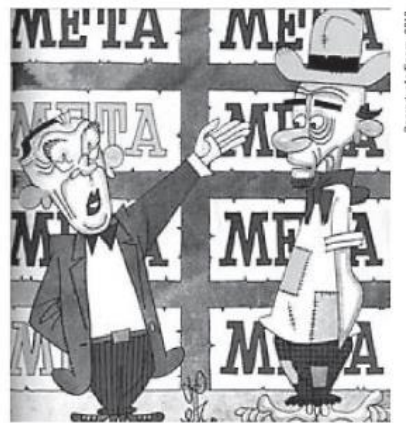
Meta de Faminto

JK – Você agora tem automóvel brasileiro, para correr em estradas pavimentadas com asfalto brasileiro, com gasolina brasileira. Quer mais quer? JECA – Um prato de feijão brasileiro, seu doutô!