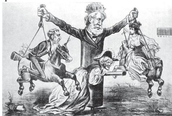
O rei se diverte, charge de Cândido Aragonez de Faria, publicada no jornal O Miquelefe em 1878. Na imagem, dom Pedro II aparece em um carrossel segurando as representações dos dois principais partidos da época, o Liberal e o Conservador, enquanto a roda é movida por uma senhora de idade avançada, que representa a chamada diplomacia imperial.

Observe a imagem e responda as questões 07 e 08.