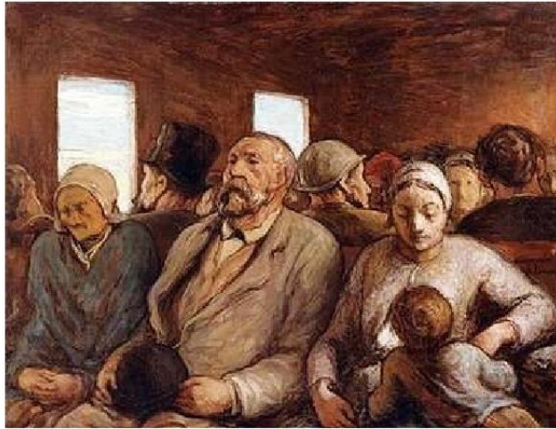
O vagão de Terceira Classe- J. B. Daumier(1808-1879)

Na tela acima vemos a pintura intitulada " O vagão de terceira Classe, Daumier"- 1862, que faz parte de um ciclo importante da reflexiva obra do artista. O rei Louis Philippe prendeu Daumier, por conta do artista ter produzido uma caricatura do rei engolindo sacos de ouro extorquidos do povo, mas mesmo assim continuou produzindo obras provocadoras, entre elas podemos destacar "O vagão da terceira classe" onde o artista retrata um grupo de trabalhadores que viviam em condições sub humanas, ao olharmos para a cena temos a sensação de que as pessoas estão tristes em um espaço apertado como meros animais.