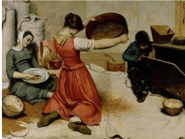
Moças peneirando trigo (1853-54), de Gustave Coubert, mostra o trabalho braçal feminino

QUESTÃO 15. Aponte o contexto histórico que foi berço, estímulo da estética realista.