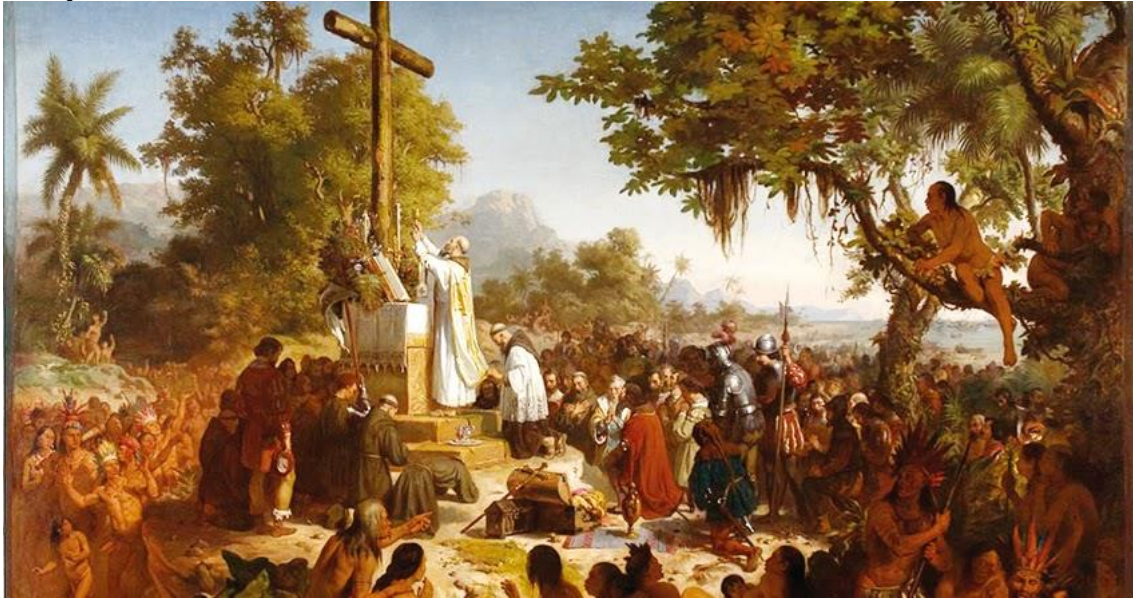
A primeira missa no Brasil – Victor Meirelles

Considerado um tesouro icônico brasileiro, o quadro A Primeira Missa no Brasil , de Victor Meirelles, passará a ser exposto ao lado da Primeira Missa no Brasil de Cândido Portinari, obra recém adquirida para o acervo do Museu Nacional de Belas Artes no Rio de Janeiro. Óleo sobre tela, que mede 270 x 357 cm, foi realizado pelo catarinense Meirelles em dois anos de trabalho - entre 1858 e 1860. Inspirada na carta de Pero Vaz de Caminha.