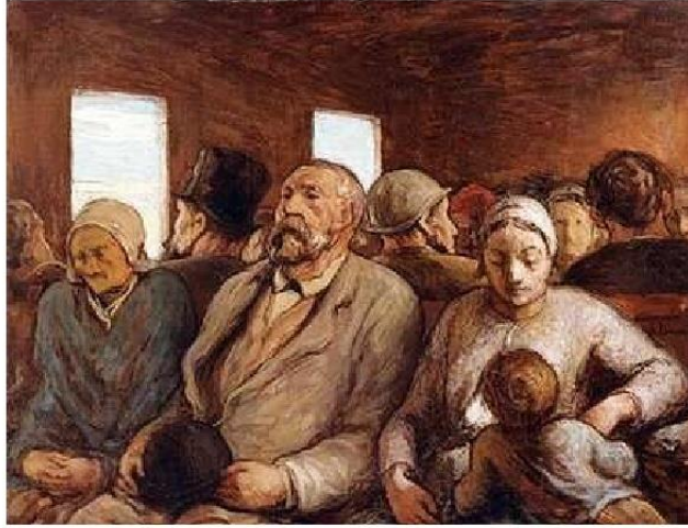
O vagão de Terceira Classe- J. B. Daumier(1808-1879)

Na tela acima vemos a pintura intitulada " O vagão de terceira Classe, Daumier"- 1862, que faz parte de um ciclo importante da reflexiva obra do artista. O rei Louis Philippe prendeu Daumier, por conta do artista ter produzido uma caricatura do rei engolindo sacos de ouro extorquidos do povo, mas mesmo assim continuou produzindo obras provocadoras, entre elas podemos destacar "O vagão da terceira classe" onde o artista retrata um grupo de trabalhadores que viviam em condições sub humanas, ao olharmos para a cena temos a sensação de que as pessoas estão tristes em um espaço apertado como meros animais.