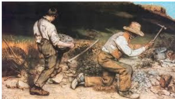
Os quebradores de pedras- Gustave Coubert, 1849